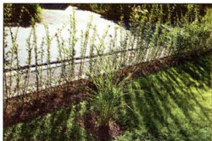
Häck på gång. Ligusterhäcken växte sig hög i somras men ska klippas regelbundet för att bli tät.