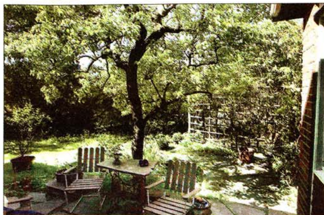
Skuggigt. Trädgården har mycket skugga och det var skönt i förra sommarens hetta.